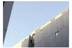
CASAS AV CASTILLA Y LEON 2-4-6-8