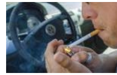
PROHIBIR FUMAR AL CONDUCIR